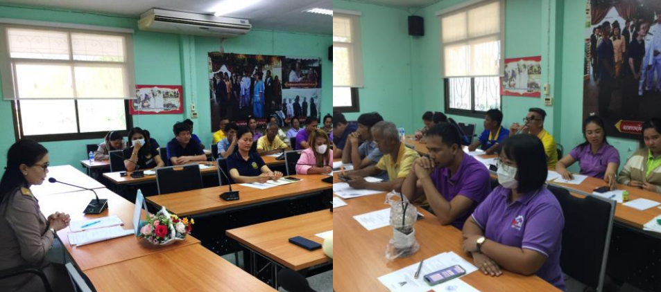
ภาพถ่ายกิจกรรมองค์กรคุณธรรมและ ขับเคลื่อนนโยบาย No Gift Policy จากการปฏิบัติหน้าที่